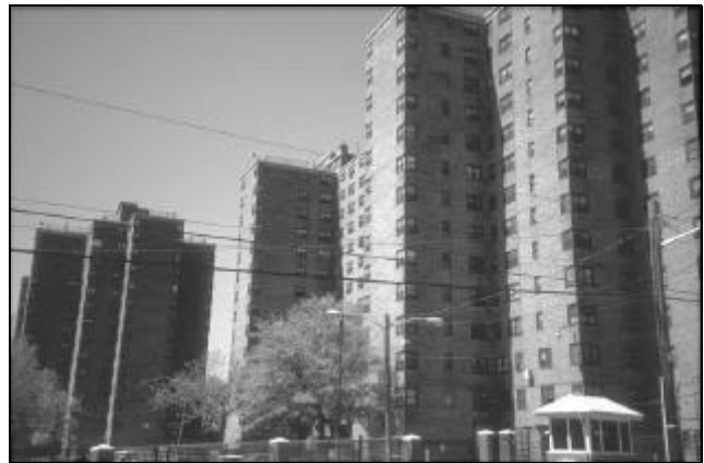
AB. 6 STELLA WRIGHT COMPLEX

gen. Binnen oogt het als een overheidskantoor in Oost-Europa voor de val van de Muur. Bewoners staan in eindeloze rijen te wachten om door ongeïnteresseerd personeel te woord gestaan te worden. Achter in het gebouw zetelt de manager. Na onze uitleg belt hij met een verveeld gezicht zijn superieur. Diens komst, een dik half uur later, levert ons een sta-