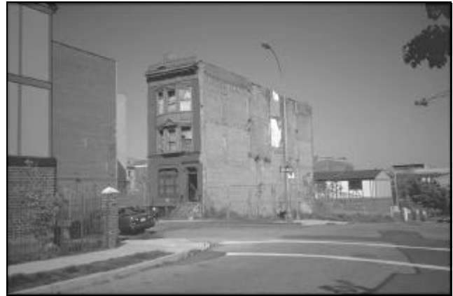
Abt. 17 STRAATBEELD IN SOUTH BRONX