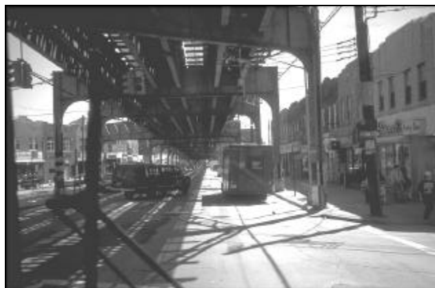
ABF. 15 BROOKLYN

en ingrijpende renovaties. Een substantiële daling (80%) van het vandalisme is ook wel iets om aan buitenlanders te vertellen. Hoewel Newark onder de rook van New York ligt, geven de economische motoren Pennstation, het vliegveld en de overslaghaven (vooral veel nieuwe auto's komen hier aan) de stad onafhank-