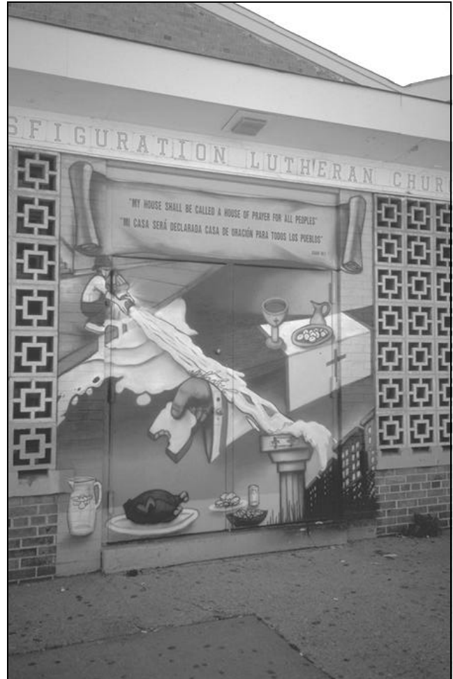
AFB. 3 SOUTH BRONX, LUTHERAN CHURCH

Gebiedsgebonden missiewerk. Het motto lijkt te zijn: 'deze buurten en hun inwoners mogen niet aan hun lot worden overgelaten'. Het startpunt is de morele verontwaardiging over het afhaken van de lokale en centrale overheid. Dweilen met de kraan open is nog altijd beter dan niets doen. Op langere termijn is de inzet zoveel in gang te zetten, dat overheid en private partijen weer in het gebied willen gaan investeren. Eerst moet gewerkt worden aan lotsverbetering van de huishoudens. In South Bronx bezochten we een initiatief van Lutheranen. In een gebied waar regelmatig jongeren het dodelijke slachtoffer zijn van afrekeningen in de drugswereld, waar de fysiek-ruimtelijke en sociale verloedering overal zichtbaar en voelbaar aanwezig is, heeft de vrouwelijke dominee / voorganger samen met een aantal helpers de strijd aangebonden. Huisvesting komt van de grond via Nehemiah Housing projecten. Er worden nieuwe scholen gesticht en werk gezocht. In diverse bijdragen wordt hieraan vanuit een eigen invalshoek aandacht besteed. ●