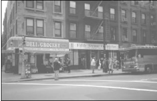
AFB. 12 FIFTH AVENUE COMMITTEE