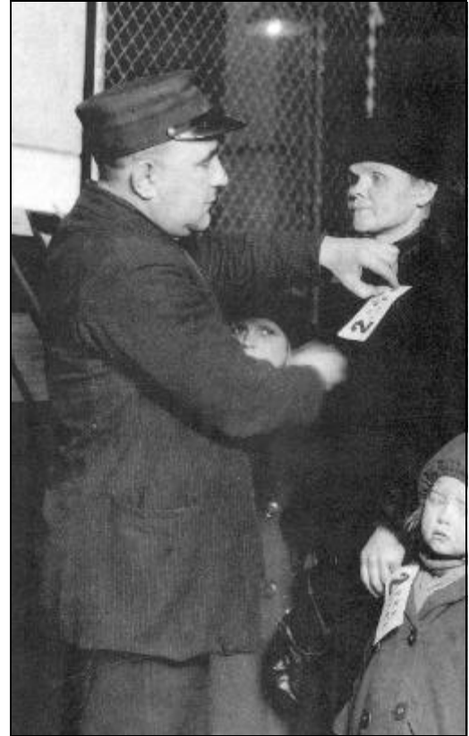
Arb. 22 IMMIGRATIEBEAMTTE OP ELLIS ISLAND, EIND JAREN '20 (ARCHEFFOTO)

duizenden extra visa opleveren voor immigranten met hogere opleidingen, speciale vaardigheden of geld om te investeren. Wettenmakers betogen dat de voorkeursregeling voor verwanten waardevolle kandidaten zonder die banden uitsluit. Het zoeken naar een evenwichtig compromis gaat door, maar het idee van miljoenen dat Amerika het land van beloften is, blijft. ●