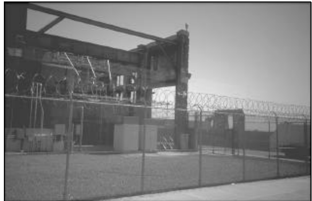
Arb. 16 INDUSTRIE IN SOUTH BRONX

toch groot. Er wordt ook voor de minder draagkrachtigen gebouwd en de kern van de bewoners blijft in de buurt. Opvallend aspect van Brooklyn is de kleinschaligheid die een belangrijk deel van het gebied kenmerkt. Ook in de nieuwbouw is de laatste tien jaar de kleinschaligheid (eengezinswoningen in een matige dichtheid) uitgangspunt. Woningen in hoogbouw zijn onder meer door de zeer strenge brandpreventie-eisen en voorschriften bijzonder duur. Sociale huurwoningen worden niet gebouwd, het ontwikkelen van private property is bij de woningbouw randvoorwaarde.