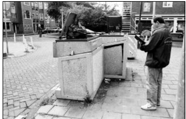
AB. 7 BUURTCONCIERGE IN BOS EN LOMMER

In het Amsterdamse model is er nog steeds een scheiding van verantwoordelijkheden. De corporatie verrijkt bijvoorbeeld geen pure welzijnstaken en de welzijnsstichting bouwt geen woningen. Er is wel