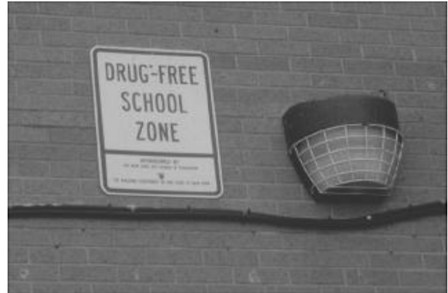
Abf. 10 GEVELOPSCRIFT SOUTH BRONX