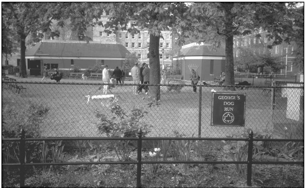
AFB. 24 GEORGE'S DOGS RUN