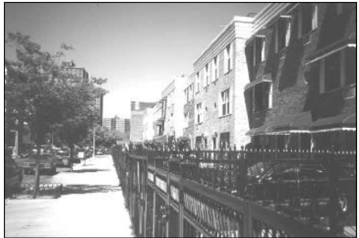
AFB. 21 SOUTH BRONX

mer". Ik stap uit en loop door winkelcentrum Amsterdamse Poort. Lang leve de zegeningen van het Nederlandse poldermodel. ●