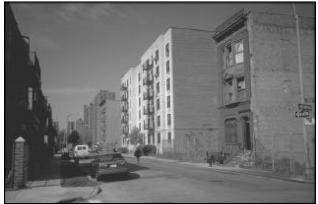
Abb. 18 STRAATBEELD BRONX

doortrokken van allerhande belangenverstrengeling 4 . Van de Boroughs heeft Brooklyn de meeste inwoners. Van de groep oude immigranten zijn de 'etnische' buurten, zoals Little Odessa (Russisch), Crown Heights en Williamsburg (Chassidische Joden) nog pregnant aanwezig. Ook de 'worst slums' van New York - Brownsville, East New York en Bedford Stuyvesant - liggen in Brooklyn. Spike Lee's Do the Right Thing bij