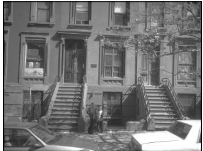
Arb. 19 HARLEM

de 125 th Street te ontwikkelen, op de grens tussen Upper en Central Manhattan, gaan niet van een leien dakje. Kapitalisme heeft zo zijn eigen plannen. Goed, even weer terug naar de Baptist Church. We kwamen vrij vroeg aan, moesten een toegangskaartje kopen en hebben een plaatsje gezocht op het 'balkon'. Je voelt je toch wat ongemakkelijk als indringer bij een religieuze viering. Gaandeweg vulde de kerk zich; het werd steeds duidelijker dat wij niet de enige toeristen waren. Uiteindelijk werd minstens driekwart van de kerk bezet door toeristen. Prima, het geld heeft zijn