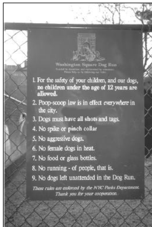
AFB. 23 HUISREGELS VAN DE DOGRUN

omfhoog, die één van de toegangen tot het park is. In het park staat een beeld van Garibaldi, een verwijzing