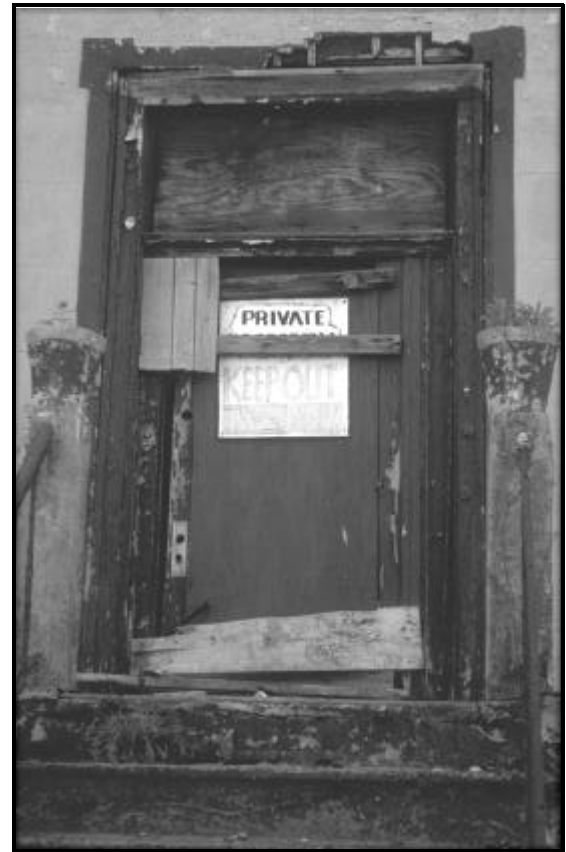
AFB. 2 HARLEM

het leven van de mensen reguleert. De tweede betreft de verhouding tussen de activiteiten van de overheid, instellingen, private ondernemers en bewoners van de gebieden waarin vernieuwing plaatsvindt. Vanuit deze vereenvoudiging, zou je kunnen zeggen,