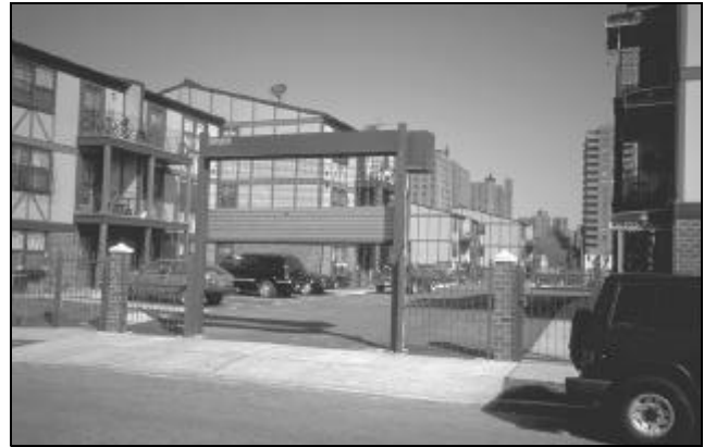
Arb. 13 NEHEMIAH HOUSES

gevangenis in de Bronx gebouwd zijn met onder meer het argument de transportkosten van de (vooral zwarte) gevangenen laag te houden: bouwen bij de bron. Misschien zijn dit metaforen. Maar lopend langs de graffiti waarmee jongeren, gedood in de drugsconflicten, worden herdacht, langs de ruineuze gebouwen, de lege terreinen, krijgt de kritiek op het beleid meer