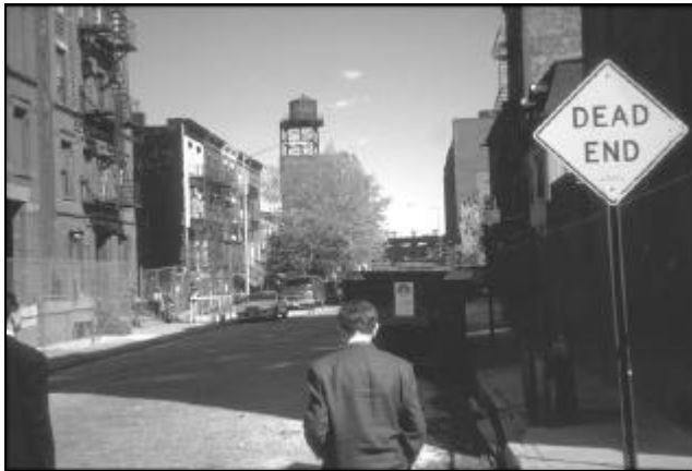
AFB. 9 TOEKOMSTIG EAST RIVER SHOPPING PLAZA

De New York City Empowerment Zone omvat de wijken Harlem en South Bronx. De staat New York en New York City leggen elk $100 miljoen op de $100 miljoen van de federale overheid. Daarmee is er voor de New York Empowerment Zone voor een periode van tien jaar een bedrag van $300 miljoen aan subsidies beschikbaar. Daarnaast zal de federale overheid $250 miljoen aan belastingvoordelen ter beschikking stellen aan bedrijven die hun vestiging binnen de New