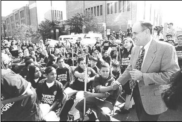
AFB. 11 BURGEMEESTER GIULIANI GEEFT HET STARTSCHOT VOOR EEN ANTI-GRAFFITICAMPAGNE