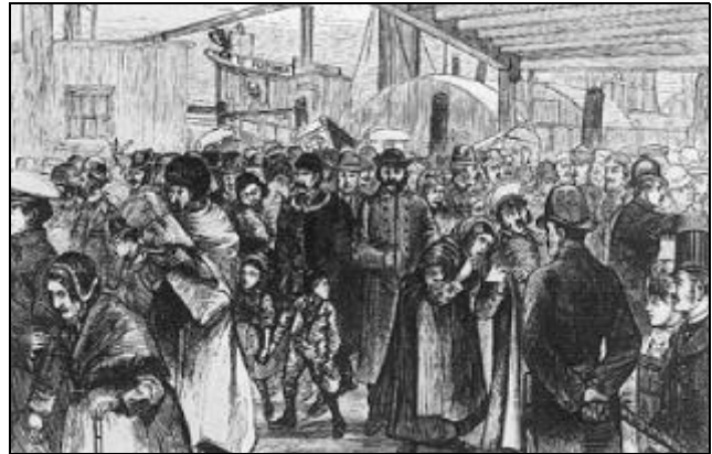
AB. 14 AANKOMST VAN MIGRANTEN, OMSTREEKS 1880

De blanke middenklasse in Amsterdam heeft geen immigrantentraditie. Zij bindt zich kennelijk eensgezind aan de Nederlandse culturele en politieke traditie. Dit