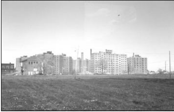
AFB. 20 NEWARK