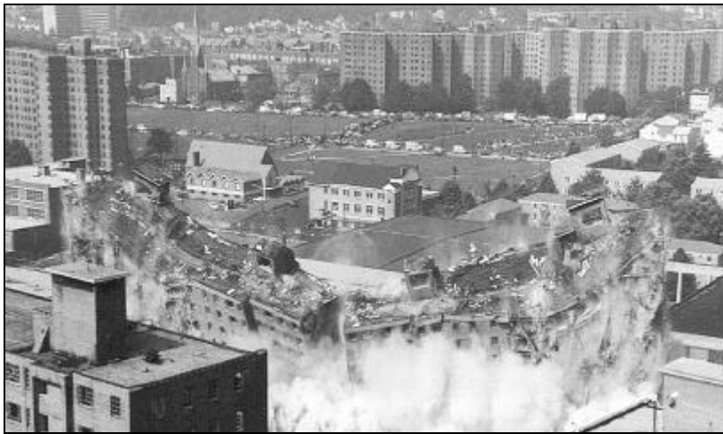
Afb. 5 SLOOP VAN HET COLUMBUSCOMPLEX

De NHA heeft vanaf 1992 drieduizend woningen in hoogbouwcomplexen gesloopt. In dezelfde periode